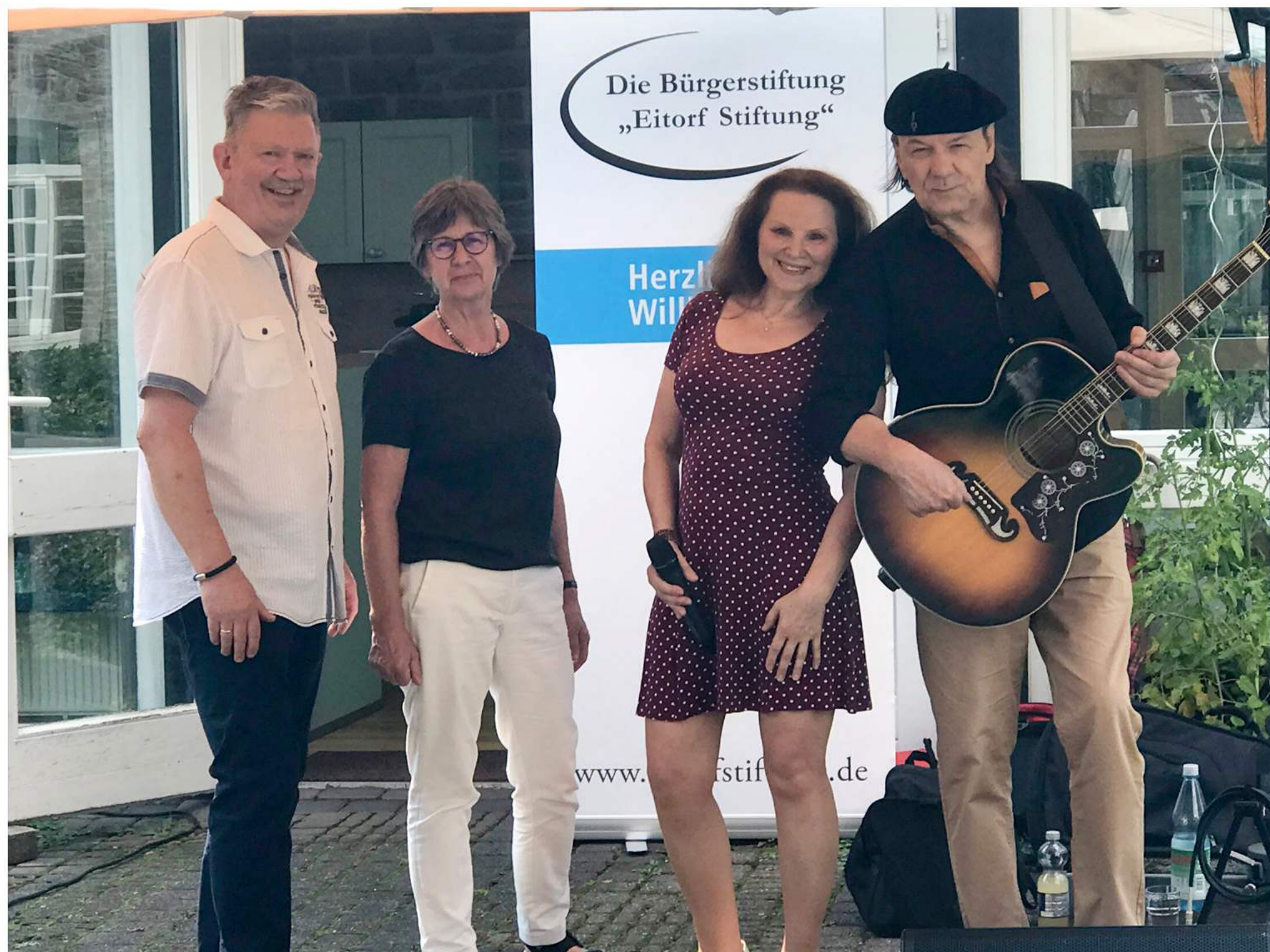
Gute Laune bei Strings 2 Voices und den Vertretern der Eitorf Stiftung

Der Juni, Juli und August standen wieder einmal ganz im Zeichen der Musik. Bereits zum fünften Mal in Folge sponserte die Eitorf Stiftung Freiluftkonzerte für die Eitorfer Seniorenzentren – Haus Merten, das Seniorenzentrum am Eipbach, das Haus am Teich und das Seniorenzentrum Eitorf.